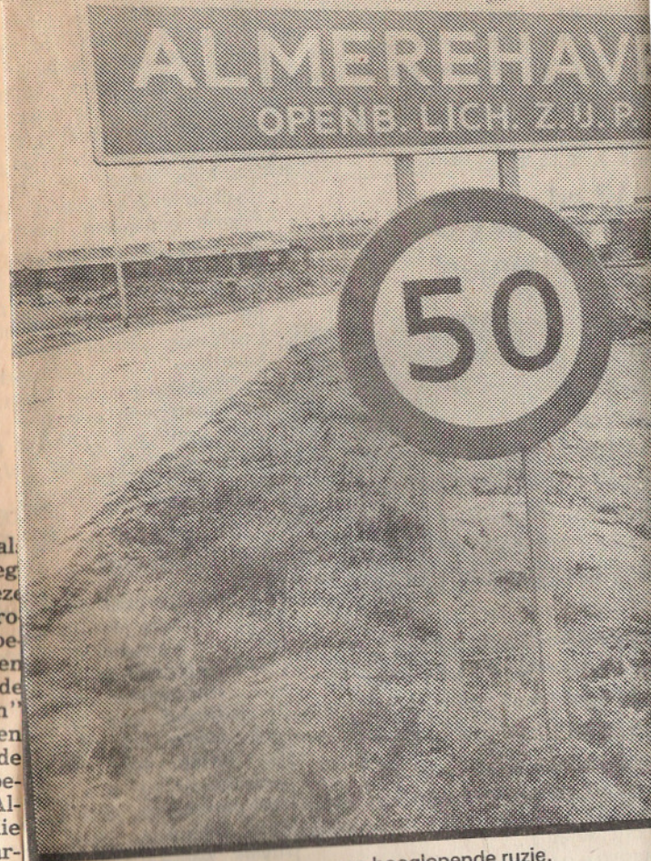
• Almere Haven is de inzet van een hooglopende ruzie.

De interne geluidsisolatie voldoet in het project inderdaad niet aan de gestelde normen. Centraal Wonen